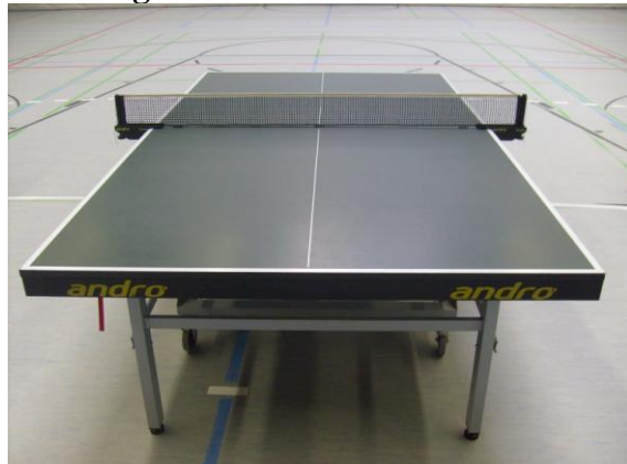
Training an Andro und Gewo Tische